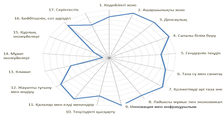
2-сурет. ТДМ міндеттерінің мемлекеттік жоспарлау жүйесімен үйлесімі

«Экономикалық зерттеулер институты» АҚ ҚР Мемлекеттік жоспарлау құжаттары жүйесіндегі орнықты даму мақсаттары мен міндеттерінің үйлесіміне Жылдам интеграцияланған бағалау (QIA) арқылы алынған нәтижелер 2-суретте келтірілген.