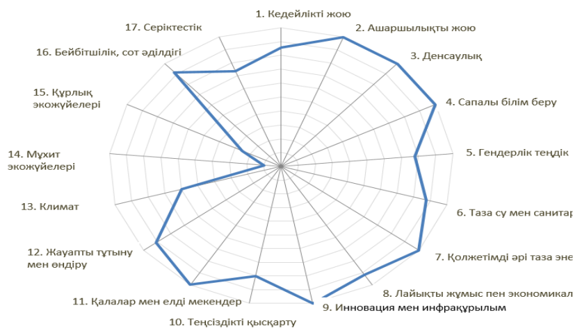
2 сурет. ТДМ міндеттерінің мемлекеттік жоспарлау жүйесімен үйлесімі

2021 жылдан бастап елімізде мемлекеттік жоспарлаудың жаңа жүйесі ендірілуіне орай мемлекеттік жоспарлау жүйесіне жаңа құжат — Жалпыұлттық басымдықтар енгізілді; Қазақстанның Стратегиялық даму жоспары Ұлттық даму жоспарына айналды; қаржыландырумен қамтамасыз етілмеген көлемді мемлекеттік бағдарламалардан Ұлттық жобаларға көшу көзделді. Жаңа жоспарлау жүйесінің зерттеу тақырыбына қатысты бір ерекшелігі — мемлекеттік жоспарлау жүйесінің құжаттарында ТДМ индикаторлары, олардың өлшемдері, орындау мерзімі секілді параметрлер қамтылуы тиісті (Қазақстан Республикасындағы мемлекеттік жоспарлау жүйесін бекіту туралы, 2017 [14]). Олар өз кезегінде сала, аумақтар мен аудан деңгейлеріндегі жоспарларда қамтылады. «Экономикалық зерттеулер институты» АҚ ҚР Мемлекеттік жоспарлау құжаттары жүйесіндегі орнықты даму мақсаттары мен міндеттерінің үйлесіміне Жылдам интеграцияланған бағалау (QIA) арқылы алынған нәтижелер 2-суретте келтірілген.