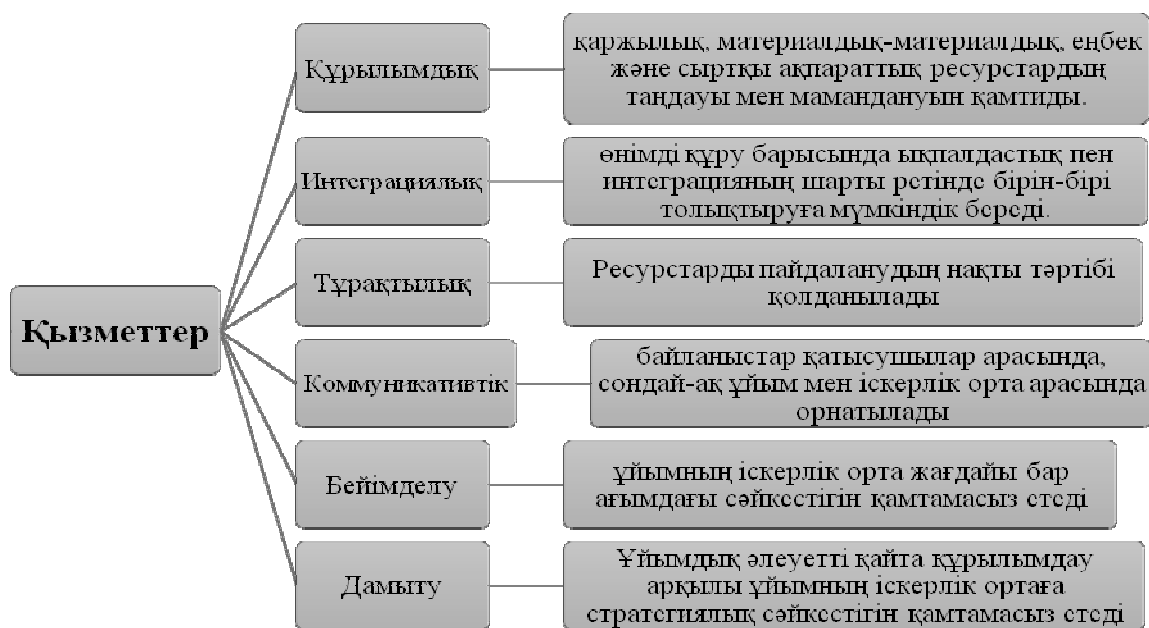
1-сурет. Ұйымдастырушылық әлеуетінің қызметтерінің құрылымы (автормен [2, 3, 9] мәліметтері негізінде әзірленген)

Көптеген ғалымдар ұйымдастырушылық әлеуеттің келесі қызметтерін ұсынады: құрылымдық, интеграциялық, тұрақтылық, коммуникативтік, бейімделу және дамыту (1-сур.).