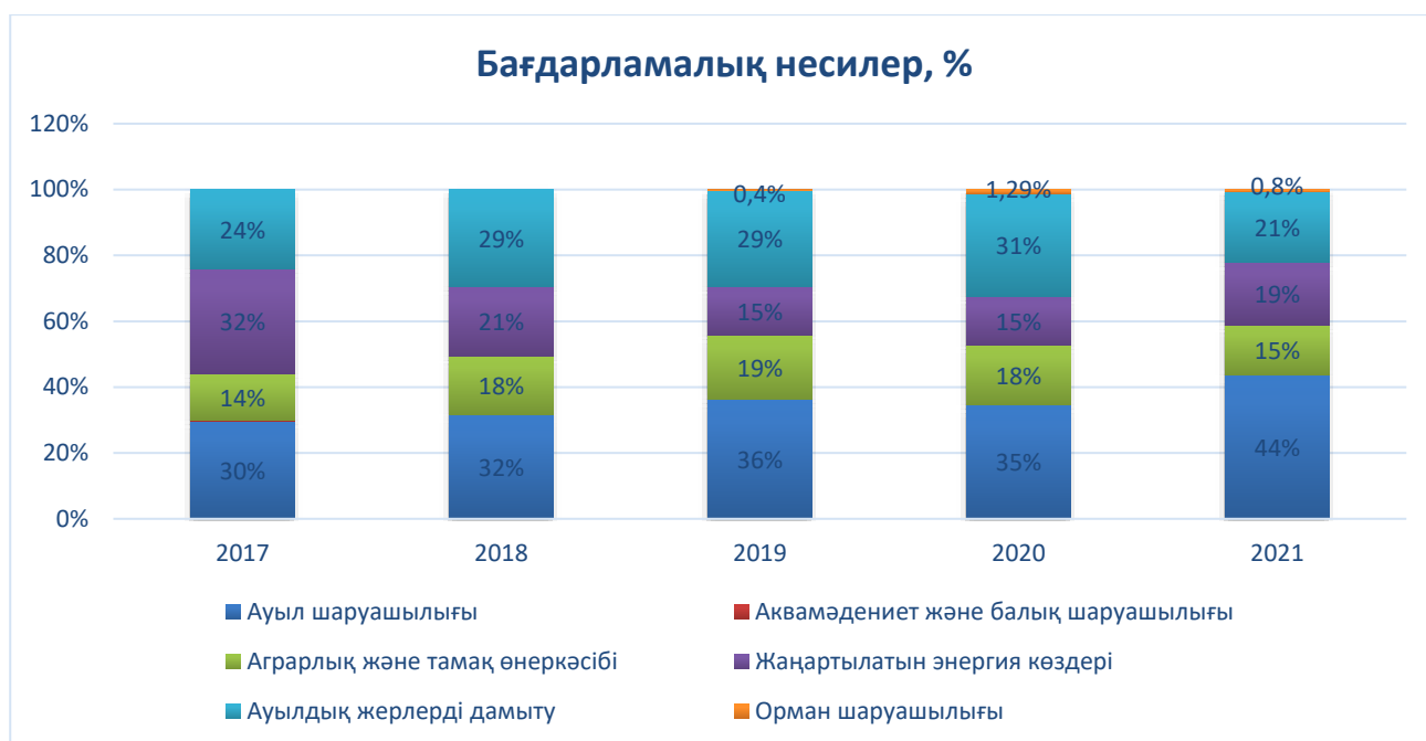
4-сурет. Бағдарламалық несиелер, млн евро

Ескерту — автор мәліметтер негізінде құрастырған (ГФР Ауыл шаруашылық рента банкі)