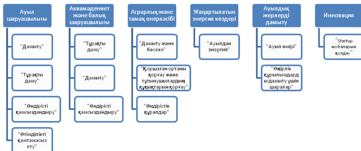
3-сурет. Германиядағы Ауылшаруашылық банкінің бағдарламалары

Бүгінгі таңда Ауыл шаруашылық жалдау банкі бар, оның мақсаты Германияның ауыл шаруашылығы мен ауылдық аумақтарын дамыту болып табылады, ал федерация мен жерлердің тиісті өкілеттіктері ескеріледі (Steil, C., et al., 2016). Банк стандартты даму кредиттерін беруге, сондай-ақ банк бағдарламаларында көрсетілген агробизнес пен ауылдық өңірлер үшін аса тиімді шарттарда бөлінетін арнайы кредиттерге назар аударады (3-сурет).