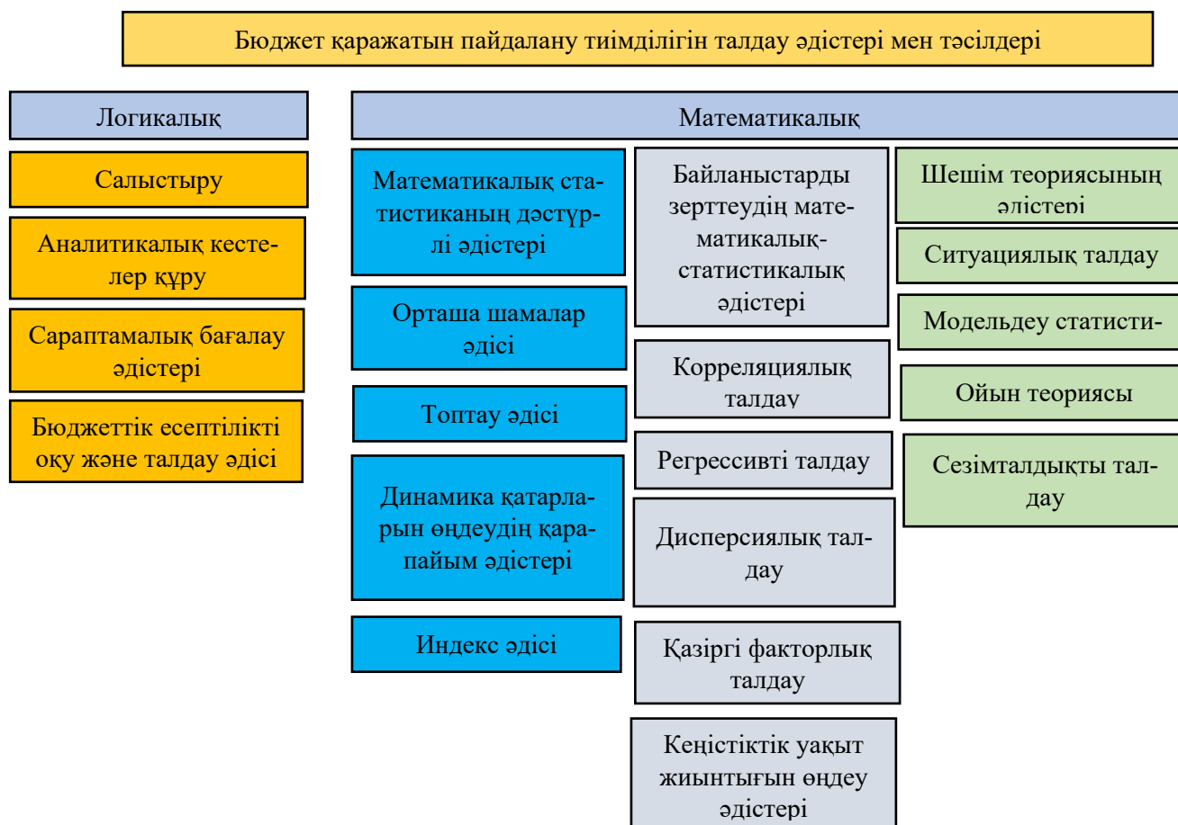
2-сурет. Бюджет қаражатын пайдалану тиімділігін талдау әдістері мен тәсілдері

Жоғары айтылғандарды ескере отырып, келесідей тұжырымдама айтуға болады, яғни мемлекеттік бюджеттің тиімділігін бағалау келесідей жүзеге асырылады (3-сурет).