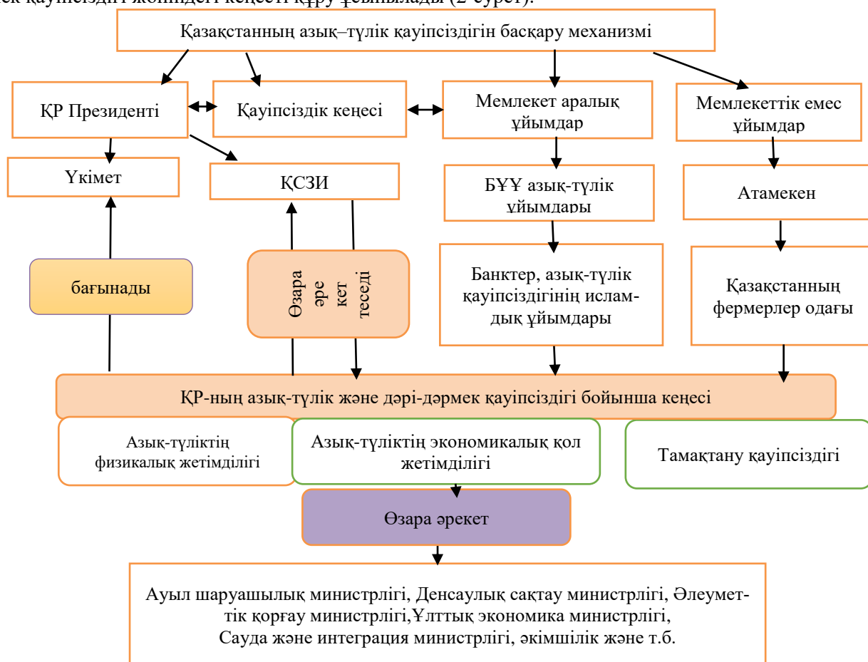
2-сурет. Қазақстандағы азық-түлік қауіпсіздігін басқару механизмі

Қазақстан Республикасы Үкіметінің жанынан Қазақстан Республикасының азық-түлік және дәрі-дәрмек қауіпсіздігі жөніндегі кеңесті құру ұсынылады (2-сурет).