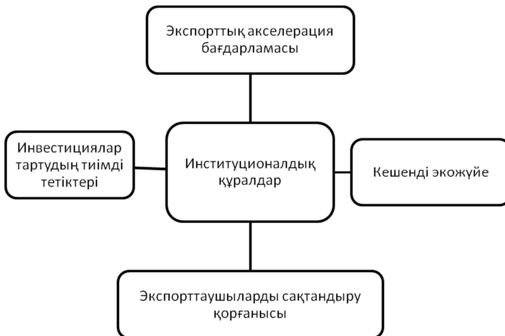
2-сурет. Тоқыма өнеркәсібі өнімдерін экспорттауды дамытудың институционалдық құралдары

Тоқыма өнеркәсібінде қалыптасқан мәселелерді шешуді институционалдық құралдарға сүйене отырып жүзеге асырған жөн. Бұл құралдарға экспорттық акселерация бағдарламасы, кешенді экожүйе, экспорттаушыларды сақтандыру қорғанысы, инвестициялар тартудың тиімді тетіктері жатады (2-сурет).