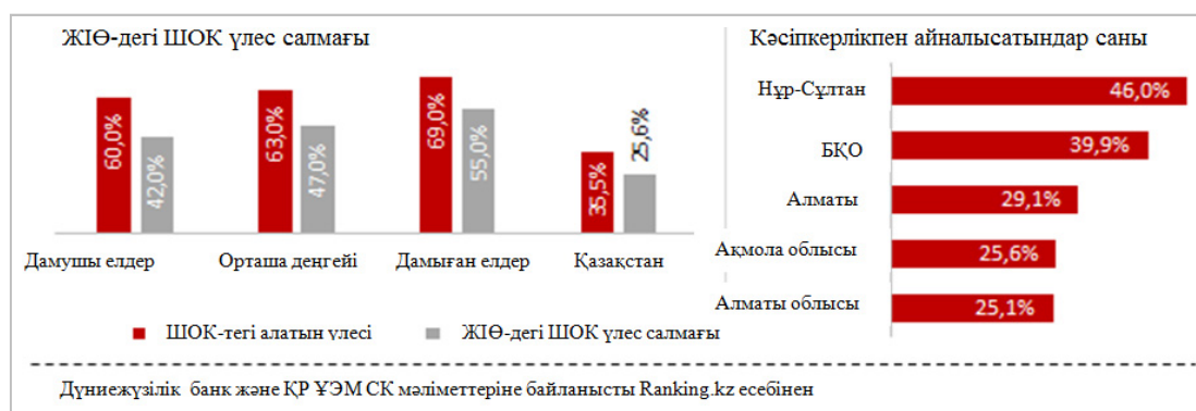
2-сурет. ЖІӨ-дегі ШОК субъектілері мен ШОК-тағы жұмысшылардың үлесі (%)

ШОК құрылымында сауда қызметін жүзеге асыратын жеке кәсіпкерлердің және жоғары біліктілікті қажет етпейтін салалардың дәстүрлі үстемдігі байқалады. Сонымен бірге әлемдік тенденция жоғары қосылған құны бар өнімдер өндірісіне көшу, инновациялық, тиімді өндіріс тетіктерін енгізу болып табылады (Қазақстан 2050). Елдің экономикасының тұрақты дамуы үшін отандық шағын және орта кәсіпкерлікті жетілдіру маңызды екені анық. Бұндай істерді анықтап, оның тиімді шешімін тапқан жағдайдағана экономикалық жетілдіруге қол жеткіземіз.