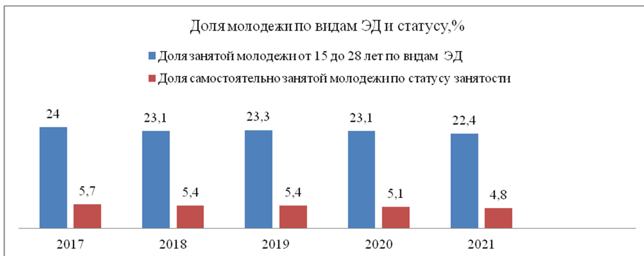
Рисунок 3. Доля молодежи по видам экономической деятельности и статусу занятости, %

На основании данных таблицы 6 сформирована диаграмма, на которой наглядно можно увидеть динамику изменения показателей за последние пять лет (рис. 3).