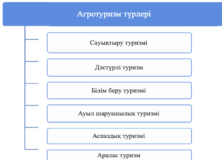
2-сурет. Агротуризмнің демалу мақсатына байланысты түрлері

Сондықтанда агротуризмнің негізгі түрлеріне сауықтыру, дәстүрлі, білім беру, ауыл шаруашылық, аспаздық және аралас туризмді жатқызуға болады (2-сур.).