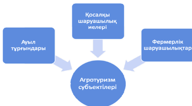
1-сурет. Агротуризм субъектілерінің құрылымы

Сондықтанда агротуризм субъектілеріне ауыл тұрғындарын, қосалқы шаруашылық иелерін және фермерлік шаруашылықтарды жатқызуға болады (1-сур.).