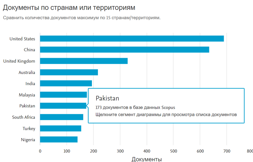
Рисунок 2. Научные литературы по странам/территориям.

На рисунке 2 показано географическое распределение научной литературы по континентам в области исследования взаимосвязи между "экономическим ростом" и "инвестициями".